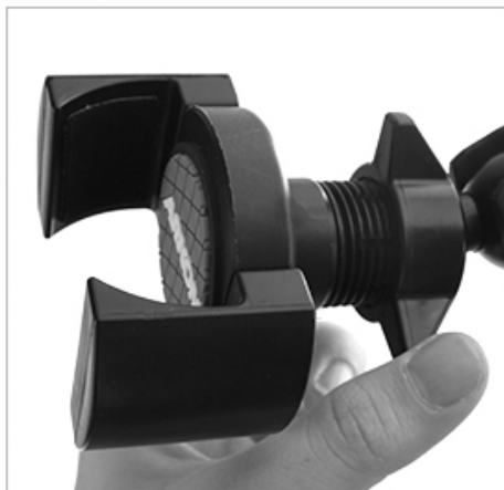
05. 각 홀더를 설치하고 링을 조여 줍니다.