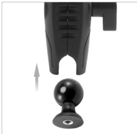
02. 카메라 어댑터와 로버스트 마운트를 연결해 줍니다.