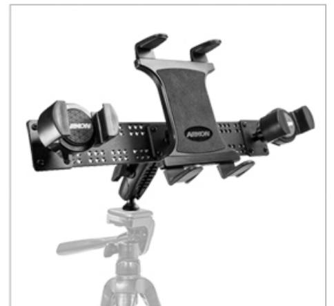
06. 설치가 완료된 모습입니다.