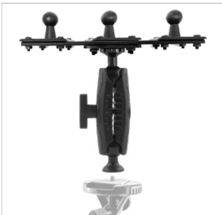
04. 설치하고자 하는 삼각대에 연결해 줍니다.