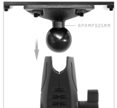
03. APAMPS25MM 어댑터와 로버스트 마운트를 연결해 줍니다.