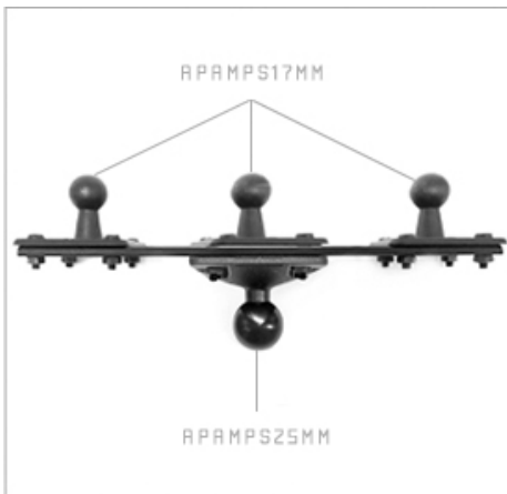
01. 각 어댑터를 나사로 고정시켜 줍니다. ※설치안내를 위한 이미지이므로 실제 길이와 상이합니다.